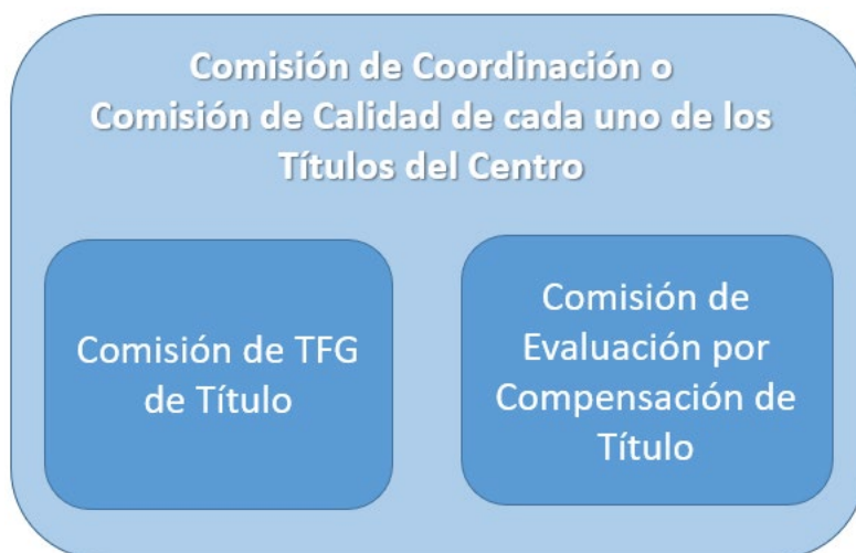
Figura 2. Otras funciones de las Comisiones de Coordinación de Título de la FFYL.

Además de la coordinación vertical y horizontal, las Comisiones de Coordinación de Título asumen otras funciones como Comisión de Trabajo Fin de Grado (TFG) y Comisión de Evaluación por Compensación de la respectiva titulación (Figura 2), según se recoge en la normativa interna al efecto de la ULE y de la FFYL.